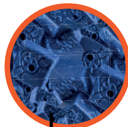
WAX BLOCK Brodifacoum