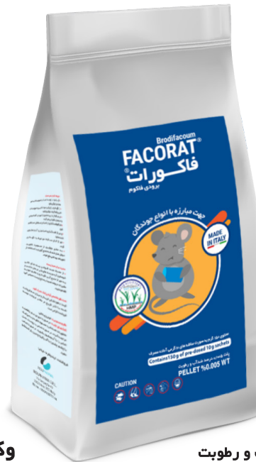
پلت ۰/۰۰۵ درصد ضدآب و رطوبت PELLET %0.005 WT