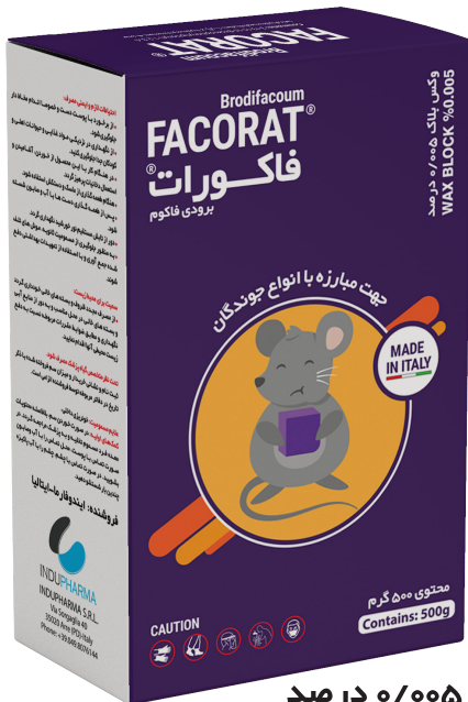
وکس بلاک ۰/۰۰۵ درصد WAX BLOCK %0.005